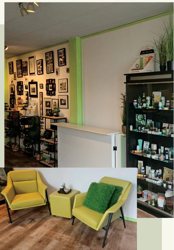
De winkel van de Cannatheek in hartje Almelo

Scan de QR code voor de cannatheek website