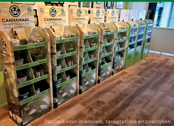
Displays voor in winkels, tankstations en praktijken

"Cannamaat biedt een innovatieve oplossing die naadloos aansluit bij elk type bedrijf, of u nu eigenaar bent van een tankstation, smartshop, coffeeshop, nachtwinkel, of een andere onderneming"